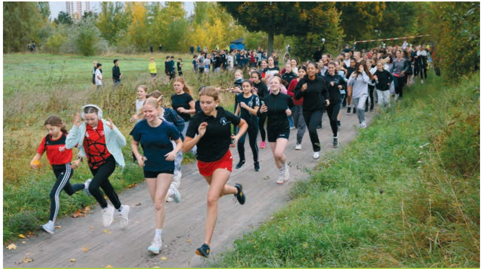
Über 300 Schüler:innen gingen bei der 38. Heinemann-Meile an den Start und zeigten Ausdauer, Teamgeist und Kampfgeist auf der neuen Strecke.