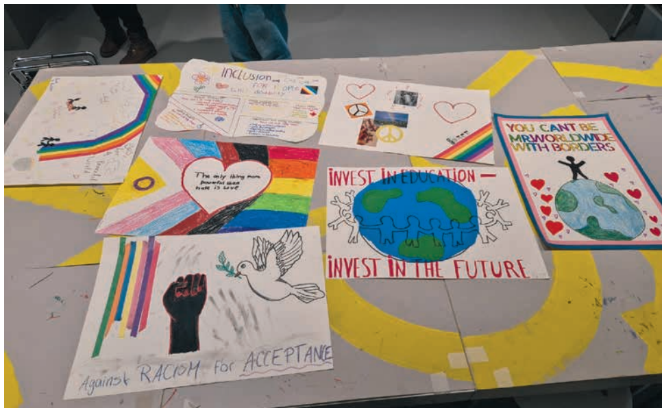
Poster für Vielfalt, Akzeptanz und Gleichberechtigung