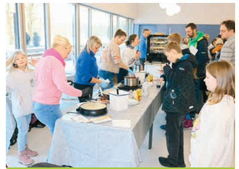
Großer Andrang in der Mensa: Der Förderverein versorgte die Gäste des Tags der offenen Tür mit Crêpes, Kuchen und warmen Speisen.

Neben den vielen Attraktionen durfte auch