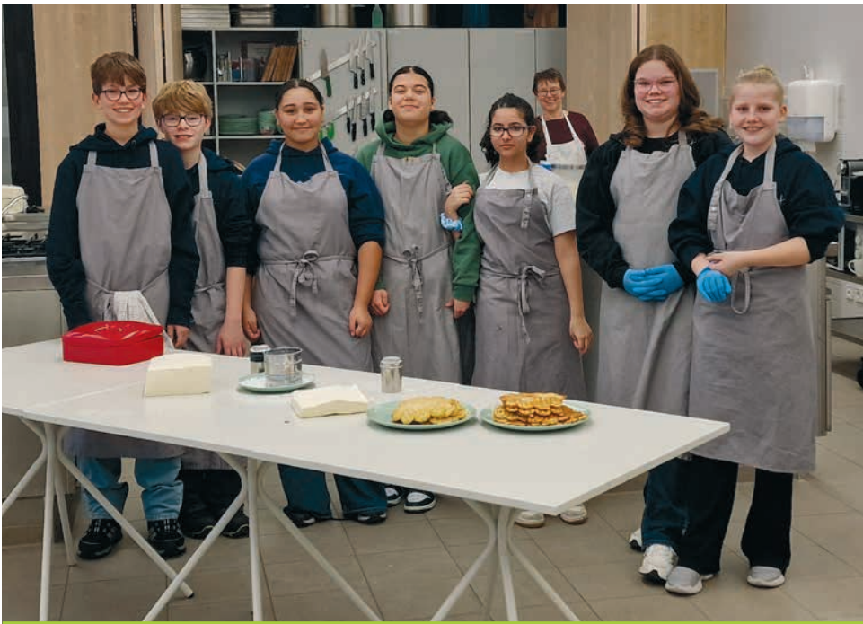
Die Lehrküche versorgte die Gäste des Tags der offenen Tür mit frischen Waffeln und guter Stimmung.