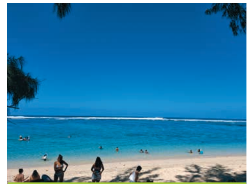
Traumstrand auf La Réunion am Indischen Ozean

Von der Schule haben wir einen Ausflug zum Vulkan gemacht, gemeinsam mit den spanischen und slowakischen Austauschschü-