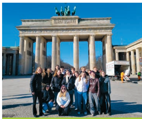
Gemeinsam unterwegs: Die Austauschgruppe vor dem Brandenburger Tor in Berlin