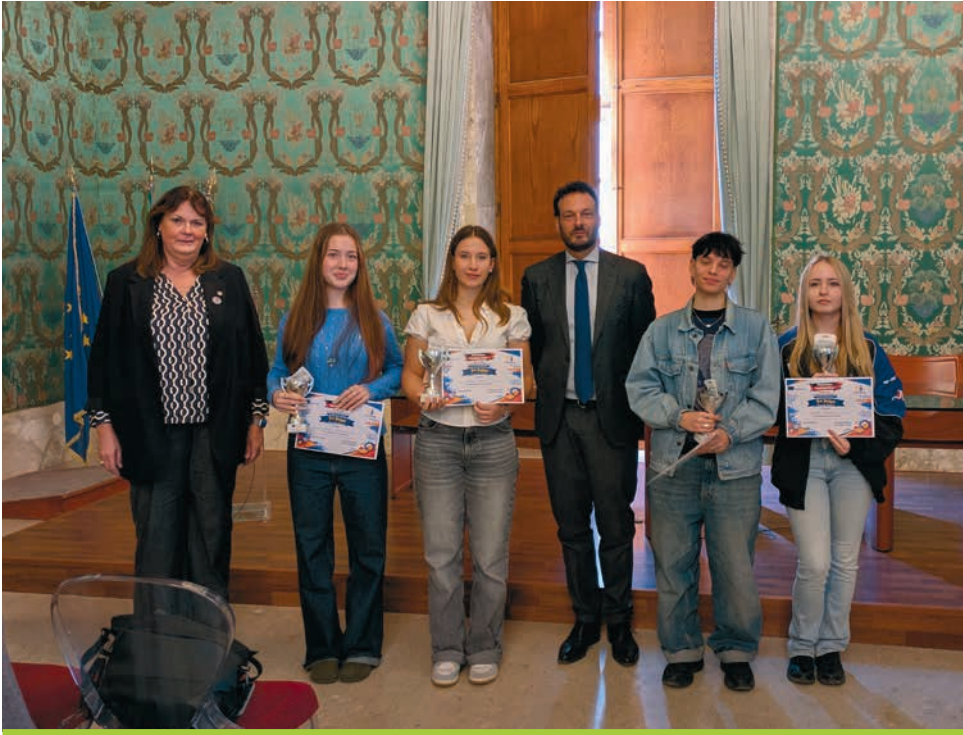
Die Sieger des Hackathon gegen Hate Speech

gemeinsames Lernen ging. Wir haben nicht nur im Team gearbeitet, sondern auch außerhalb der Workshops viel miteinander erlebt.