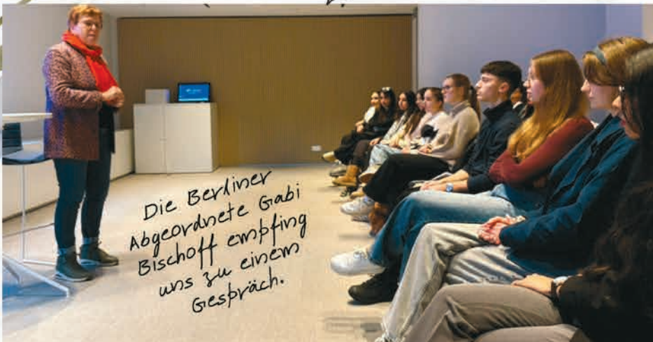
Die Berliner Abgeordnete Gabi Bischoff empfing uns zu einem Gespräch.