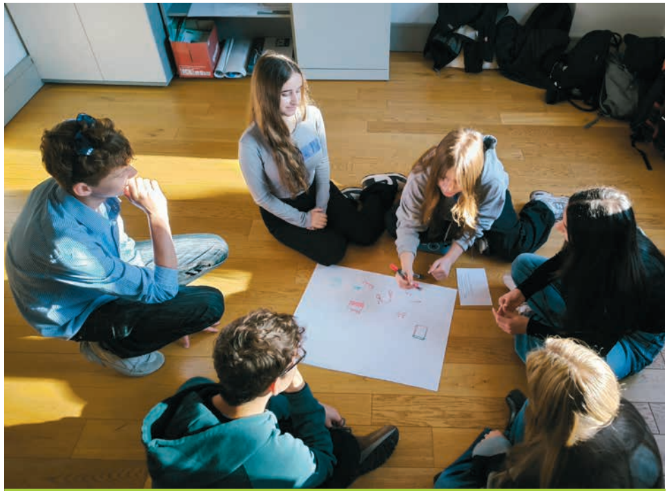
In internationalen Workshops entwickelten die Teilnehmenden gemeinsam Ideen zu Umwelt- und Europathemen.

Erasmus+ Enriching lives, opening minds.