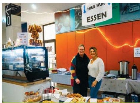
Der Förderverein sorgte beim Weihnachtskonzert mit herzhaften Snacks, Kuchen und warmen Getränken für das leibliche Wohl der Gäste.

Erst im September haben wir den neuen 5. und 7. Jahrgang mit dem traditionellen Grillfest an der GHO willkommen geheißen. Mittlerweile sind diese Schüler:innen längst in der GHO-Gemeinschaft angekommen. Ein nicht unerheblicher Anteil der Familien erfreute uns mit einem Eintritt in den Förderverein. Und wir freuen uns besonders, dass einige sogar als aktive Helfer:innen regelmäßig für uns tätig werden.