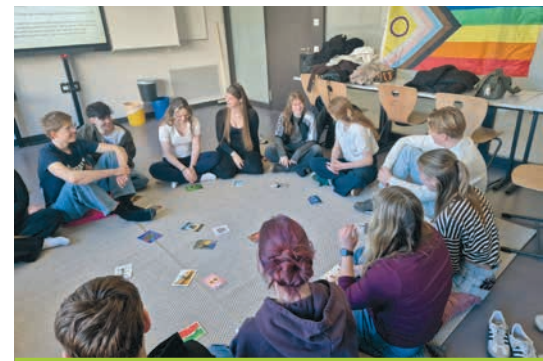
Diversity-Workshop: Austausch über Privilegien und Perspektiven