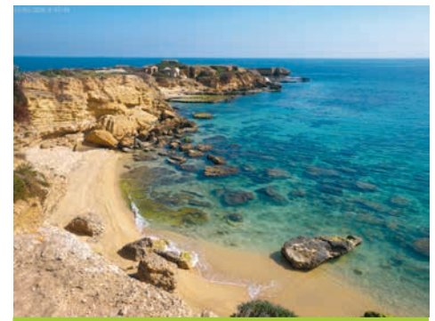
Der Strand von Plemmirio