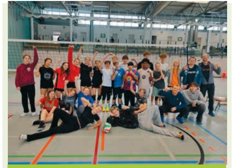
Die Volleyball-AG blickt auf drei intensive Tage in Osterburg zurück.