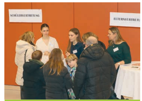
Schüler- und Elternvertretung berieten Besucher:innen am Tag der offenen Tür.

individuelle Beratungen durch und vergaben eine große Menge an Terminen für die Aufnahmegespräche für den neuen fünften und siebten Jahrgang.