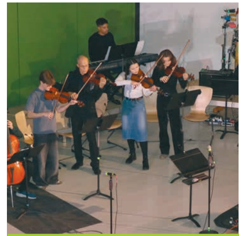
Das Streicherensemble sorgte mit emotionalen Stücken für besondere Konzertmomente.

bau ein Ende haben. Es gab noch einige Zweifel wegen der ausreichenden Beleuchtung der Bühne bzw. der effektiven Verdunklung des Zuschauerbereichs, doch die positiven Aspekte schienen zu überwiegen. Ein Vorteil war auch, dass jetzt mehr Tickets verkauft werden konnten, da unser Atrium viel mehr Personen aufnehmen kann. So sollte es in diesem Jahr nur zwei statt der üblichen drei Konzerte geben und zwar am Freitag, dem 12. und am Samstag, dem 13. Dezember. Die waren dann allerdings randvoll mit der Musik von 13 verschiedenen Ensembles gefüllt. Natürlich gab es viel Blasmusik, aber auch unsere Streicherinnen und Streicher, die Gitarren, sowie Sängerinnen und Sänger kamen nicht zu kurz. Das Programm war also spannend, jedoch auch durch seine Länge herausfordernd. Dank der vorbildlichen Versorgung mit Speisen und Getränken durch unseren Förderverein in den beiden Pausen konnten aber Ermüdungserscheinungen erfolgreich bekämpft werden.