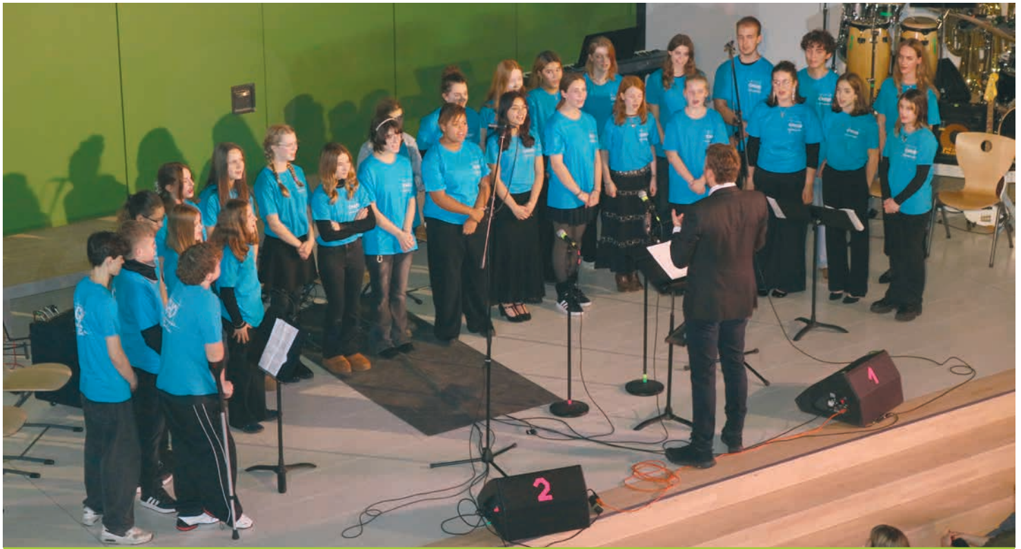
Der Chor begeisterte das Publikum mit stimmungsvollen Songs.