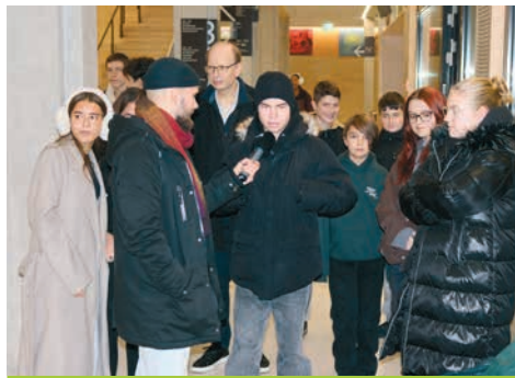
Class 11.4 during the Fritz Radio interview about their donation campaign

Coincidentally, at that very time Fritz Radio was running a campaign to support homeless people, so our teacher proposed that we take part. It didn't take much persuasion — we all wanted to be involved.