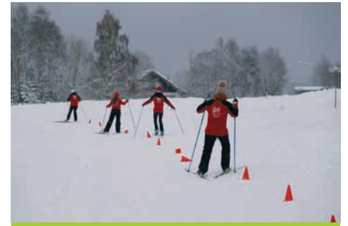
Die Skilanglauf-AG bereitete sich in Fisterau intensiv auf den Wettkampf von „Jugend trainiert für Olympia“ vor.

Bei der Siegerehrung wurde es endlich bestätigt: Die Gustav-Heinemann-Oberschule ist in der Wettkampfkategorie III sowohl bei den Jungen als auch bei den Mädchen Landessieger und kann somit ins Bundesfinale fahren. Stolz und glücklich kehrten wir mit den Medaillen am 16. Januar 2026 zurück nach Berlin.