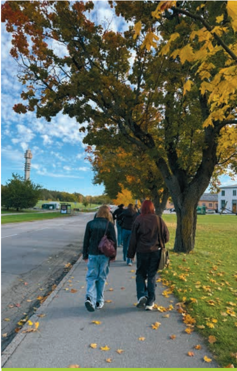
Der Schulweg durch die herbstliche Natur

Selbst am Freitag durften wir noch viel erleben. Begonnen hat der Tag mit einem Besuch im Vasa-Museum, welches das fast vollständig erhaltene Kriegsschiff Vasa aus dem 17. Jahrhundert zeigt und die Geschichte seiner Jungfernfahrt erzählt. Das interaktive ABBA-Museum war das letzte Highlight, bevor wir uns unter Tränen von unseren tollen Austauschschüler:innen verabschieden mussten.