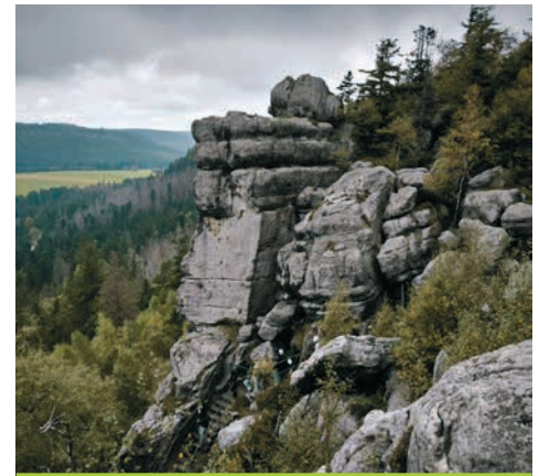
Die beeindruckenden Felslandschaften des Tafelgebirges waren ein Höhepunkt der Reise.

Erst spät am Abend kehrten wir in unsere Unterkunft im Naturschutzgebiet Pasterka zurück – müde, aber voller neuer Eindrücke.