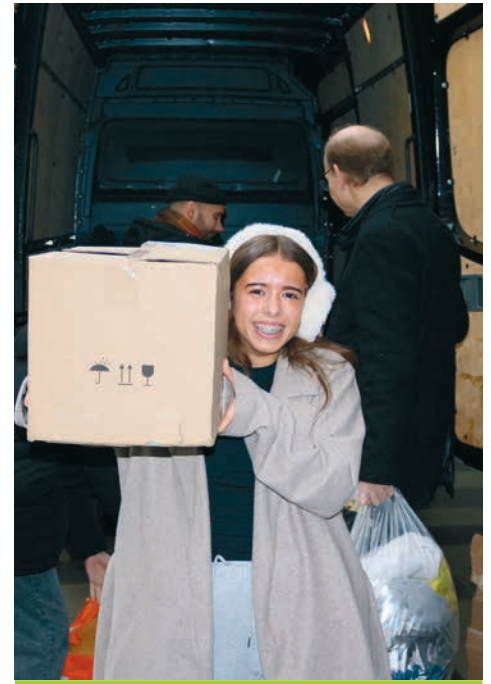
Students loading winter clothing donations into the Fritz Radio van

Coincidentally, at that very time Fritz Radio was running a campaign to support homeless people, so our teacher proposed that we take part. It didn't take much persuasion — we all wanted to be involved.