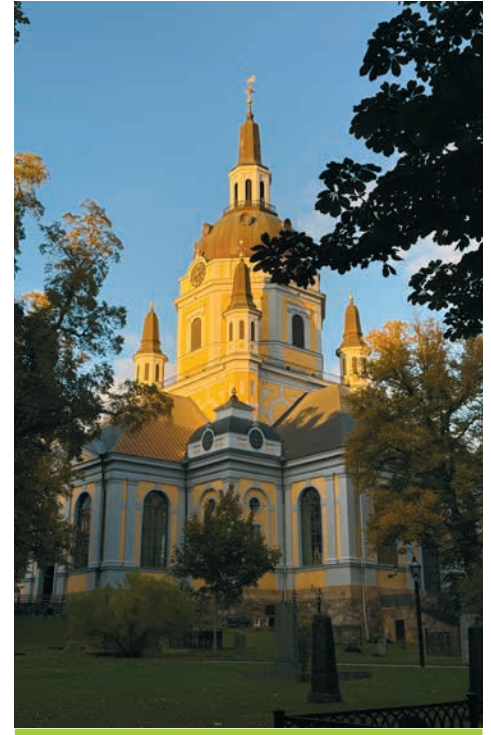
Stockholmer Abendstimmung rund um eine der historischen Kirchen der Stadt