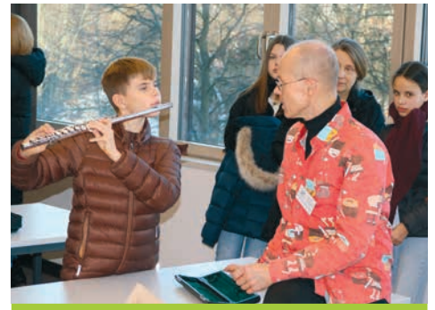
Im Fachbereich Musik konnten die Besucher:innen verschiedene Instrumente ausprobieren.