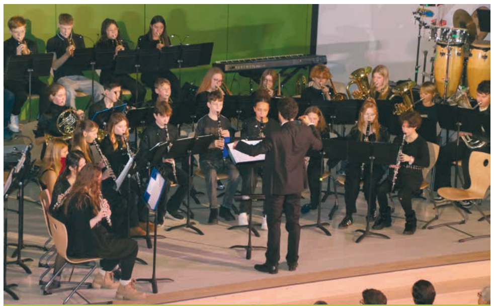
Die Bläserensembles sorgten mit festlichen und modernen Stücken für musikalische Vielfalt.

Rentier Rudolph, sehr frisch präsentiert von der Bläserklasse 9.13 (Leitung: Herr Held), oder der Song „Feliz Navidad“ der Gitarren-Band von Herrn Wießner-Drude.