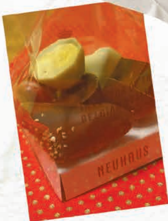
Brüssel zu fliegen.