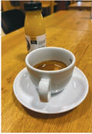
Morgens um 5.15 trafen wir uns am Flughafen, um nach ...