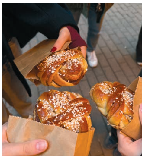
Natürlich durfte die tägliche schwedische Fika mit Zimtschnecken nicht fehlen.