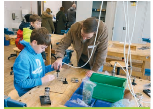
Im WAT-Bereich konnten Besucher:innen selbst aktiv werden.