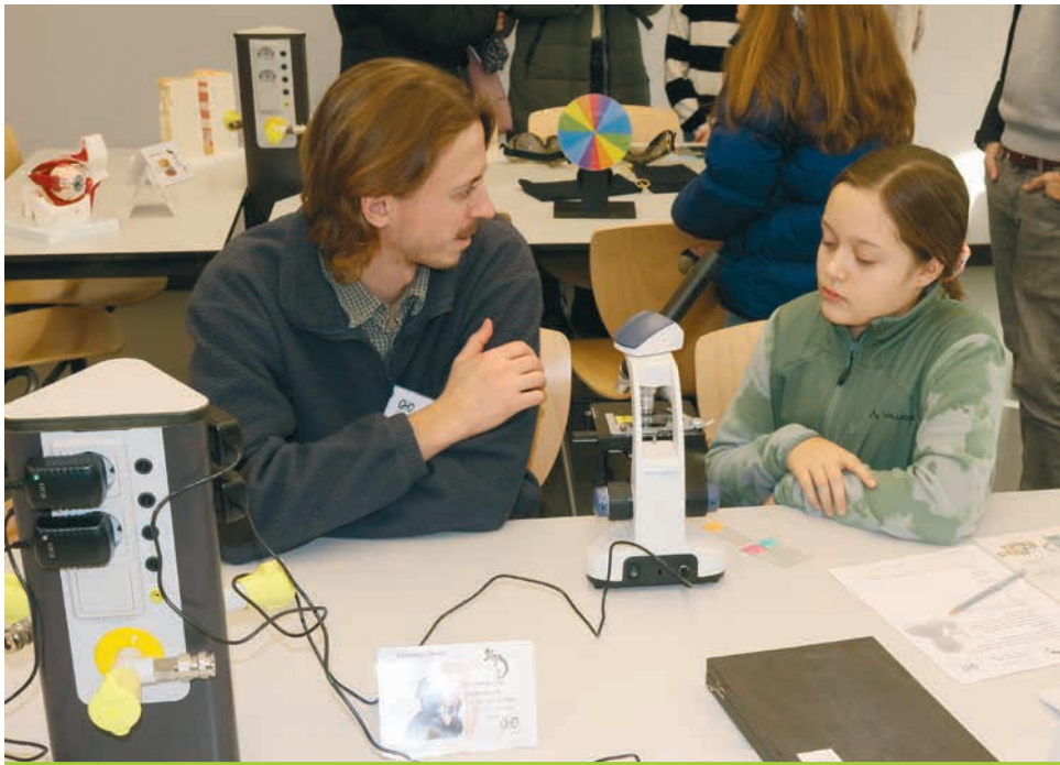
Im Fachbereich Biologie konnten Kinder selbst mikroskopieren.