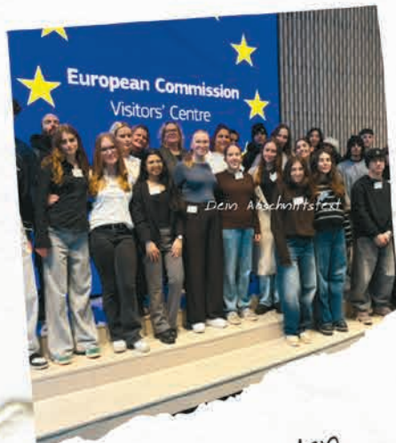
Gemeinsam werden wir in den nächsten Tagen die Institutionen der EU kennenlernen.