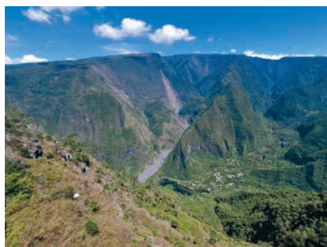
Beeindruckende Berglandschaft auf La Réunion

Die ersten zwei Tage haben wir sehr ruhig verbracht, um uns erstmal einzuleben. Am ersten Tag in der Schule Lycée Levassasseur wurden wir sehr herzlich vom Deutschkurs begrüßt, aber auch in den anderen Kursen wurden wir sehr herzlich aufgenommen. Die Schüler sind sehr nett und höflich. Uns wurden natürlich sehr viele Fragen gestellt. Wir haben festgestellt, dass die Schüler:innen dort auch untereinander sehr nett sind und sich keiner über irgendjemanden lustig macht. Auch in der Schule sind sehr viele verschiedene Kulturen, da La Réunion