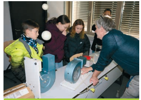
Spannende Experimente begeisterten die Gäste im Fachbereich Physik.