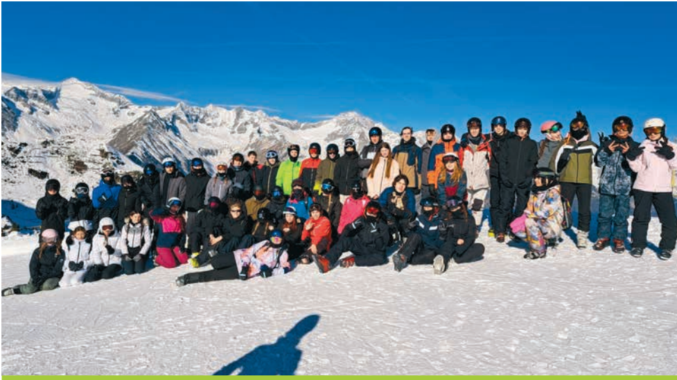
Skifahrt nach Südtirol ins Ahrntal – Sieben Tage, die wir nicht vergessen werden