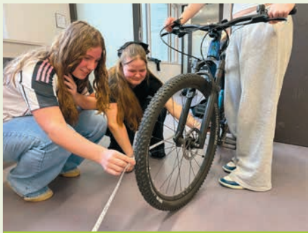
Beim Pi-Day vermessen Schülerinnen verschiedene runde Gegenstände und entdecken Mathematik ganz praktisch.

Wir haben uns intensiv mit der Zahl \pi beschäftigt und dazu Arbeitshefte erhalten. Oberstufenschüler:innen haben uns die Aufgaben erklärt, gemeinsam besprochen und mit uns bearbeitet.