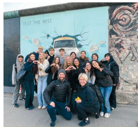
Mit den Schüler:innen aus Liepaja an der East Side Gallery in Berlin

Einige meiner Freund:innen, die ebenfalls an dem Programm beteiligt waren, trafen sich am Freitag noch einmal mit den lettischen Gästen und verbrachten gemeinsam ihre Freizeit. Sie gingen zusammen essen, besuchten die Mall of Berlin, und zusätzlich wurden einige lettische Schüler:innen interviewt. Sie beschrieben die deutsche Schule als moderner, fanden jedoch ihre eigene