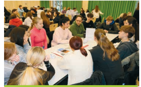
Schüler:innen des 12. Jahrgangs im Austausch mit den Rotariern über Beruf und Zukunft

Die Berufsinformationsveranstaltung mit dem Rotary-Club stellte eine wertvolle Gelegenheit für uns Schülerinnen und Schüler dar, Einblicke in unterschiedliche Berufsfelder zu gewinnen und persönliche Fragen zu klären. Besonders der direkte Austausch mit den Rotariern ermöglichte es, realistische Eindrücke vom Arbeitsalltag, sowie von individuellen Lebenswegen zu erhalten. Insgesamt wurde deutlich, wie hilfreich solche Veranstaltungen in einer entscheidenden Phase der Berufsorientierung sein können und wie wichtig es ist, verschiedene