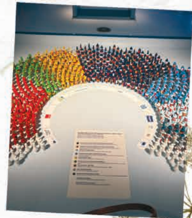
Der Parlamentarier erklärte uns die Geschichte der Europäischen Integration und stellte uns die Arbeit des Parlaments vor.