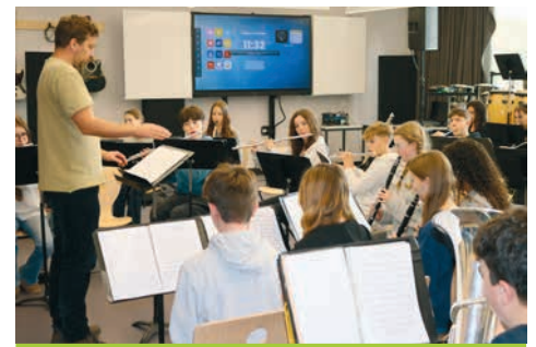
Die Klasse 9.13 begrüßte die japanische Botschafterin mit einem musikalischen Beitrag.

Anschließend fand ein Roundtable-Gespräch mit den Schülerinnen und Schülern aus den Japanisch-Grundkursen der Oberstufe statt. Dabei konnte man Genaueres über den Werdegang der Botschafterin und ihre Aufgaben in Deutschland erfahren. Sehr interessant und bewegend war der Bericht über ihre Arbeit bei den Vereinten Nationen. Zusammen mit anderen Diplo-