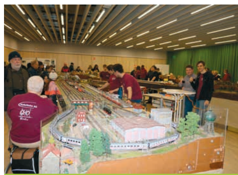
Die Modelleisenbahn der GHO war erneut ein Publikumsmagnet.

Erstmals fand unser jährlicher Weihnachtsmarkt im neuen Schulgebäude statt. Ein wagemutiger Abiturient des Jahrgangs 1989 stahl sich kurz in den zweiten Stock, um die Aussicht seines ehemaligen Klassenzimmers, diesmal durch andere Fenster eines anderen Gebäudes, noch einmal erleben zu können. Damals hieß die Schule noch GHG, aber „die Stimmung war zu dieser Jahreszeit genauso weihnachtlich!“