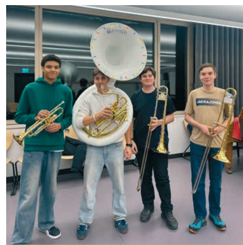
Für festliche Stimmung sorgten auch die musikalischen Beiträge auf dem Weihnachtsmarkt.