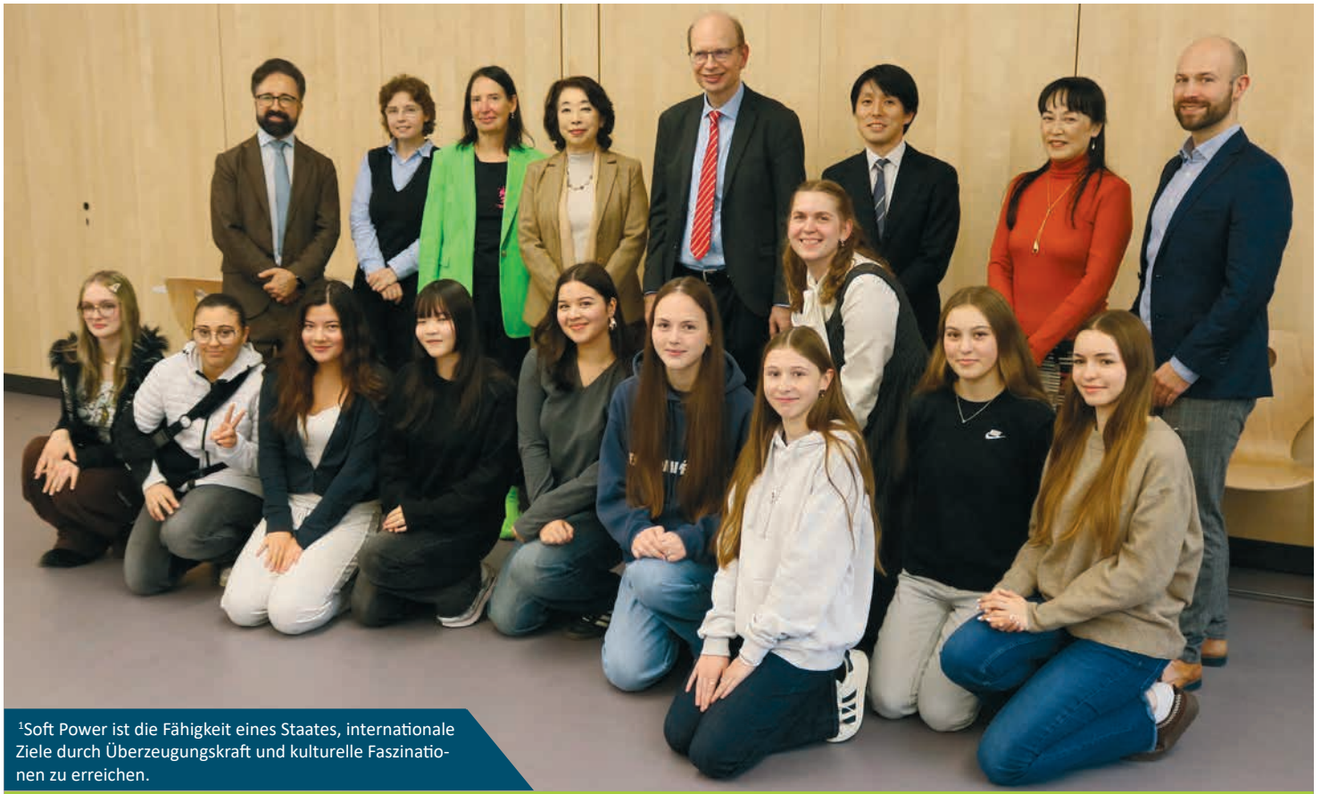
1 Soft Power ist die Fähigkeit eines Staates, internationale Ziele durch Überzeugungskraft und kulturelle Faszinationen zu erreichen.