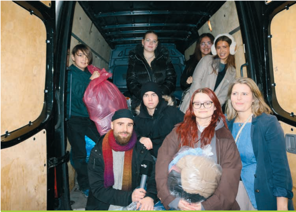
The donation team with collected winter clothes for homeless people in Berlin