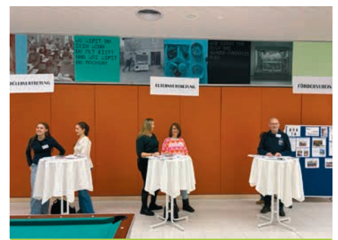
Schülervertretung, Elternvertretung und Förderverein informierten beim Tag der offenen Tür über das vielfältige Schulleben an der GHO.

Direkt nach der verdienten Weihnachtspause starteten wir ins neue Jahr. Genau 364